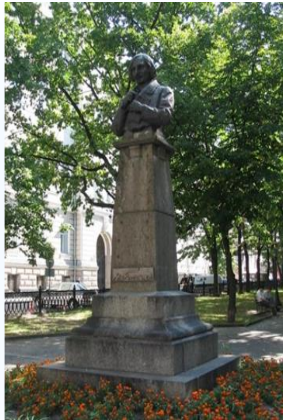
Пам'ятник Миколі Гоголю