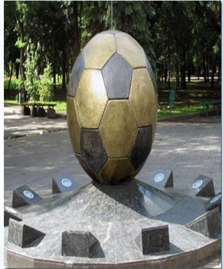
Пам'ятника футбольному м'ячу