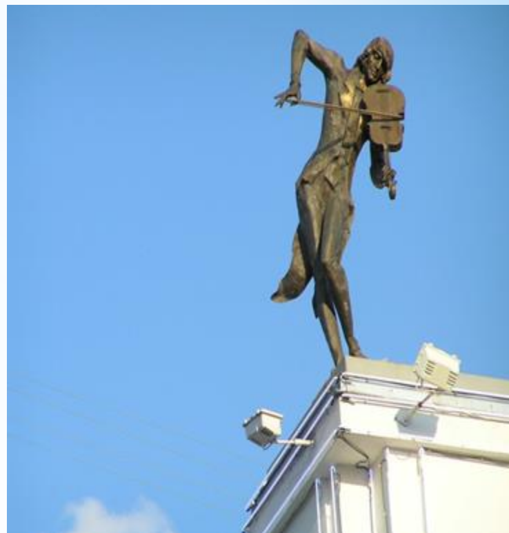
Пам'ятник Скрипалю на даху