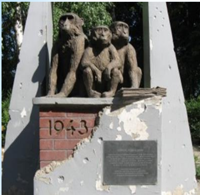
Пам'ятник трьом мавпам