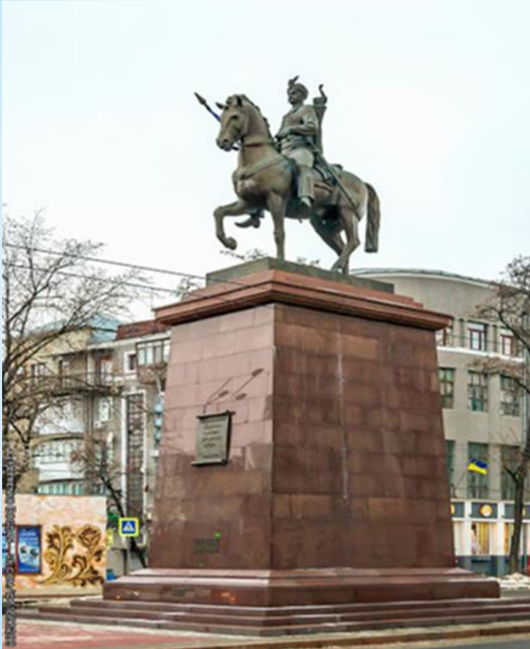
Пам'ятник засновникам Харкова