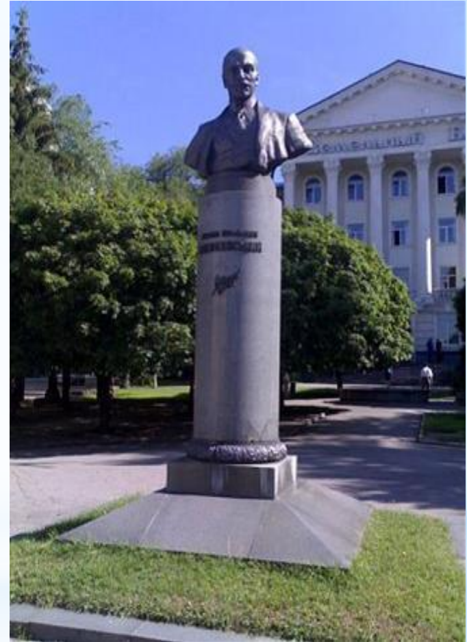
Пам'ятник Михайлу Коцюбинському