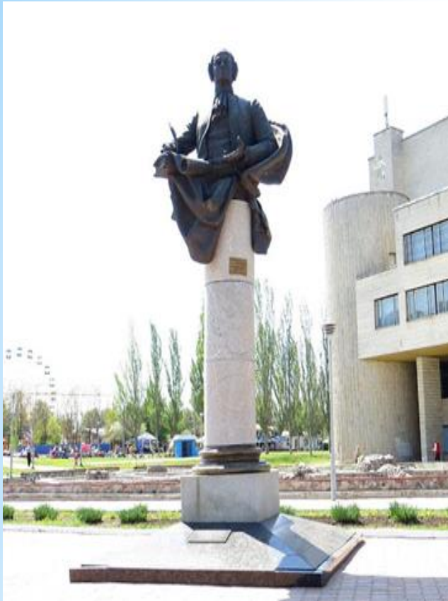
Пам'ятник Михайлу Ломоносову