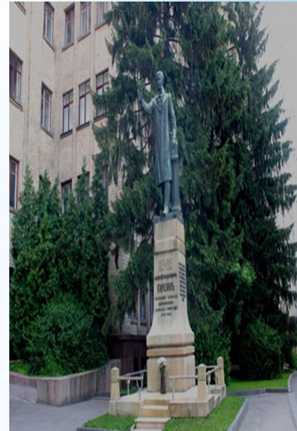
Пам'ятник В.Н. Каразіну