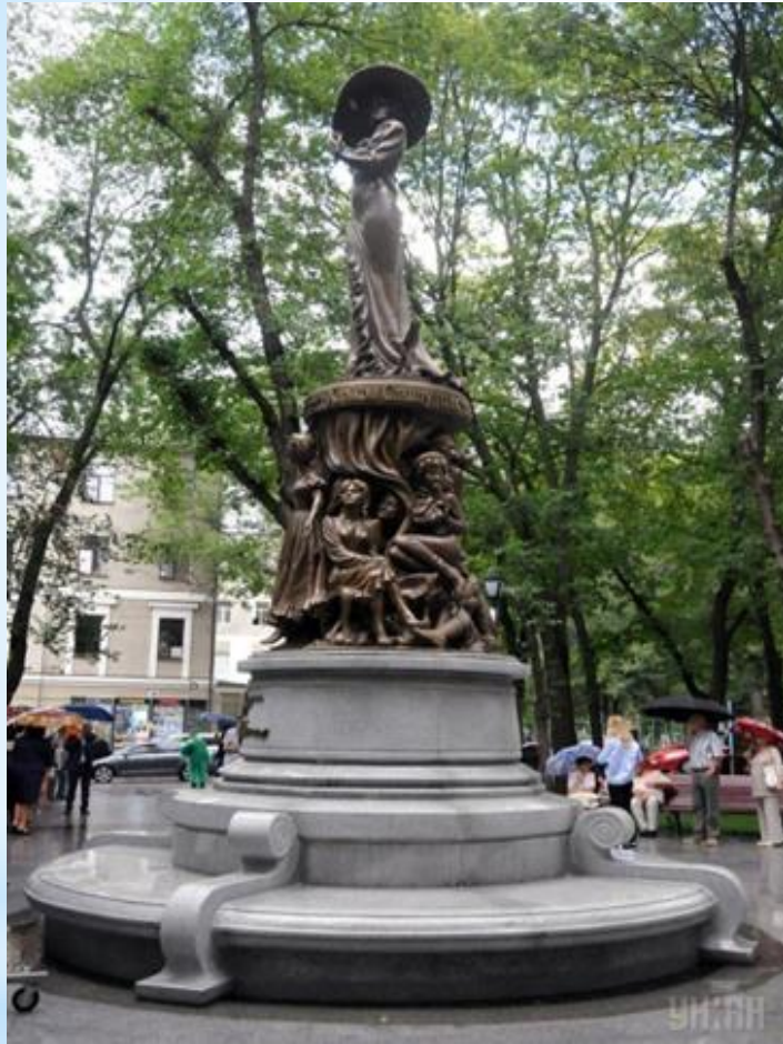
Пам'ятник Людмилі Гурченко