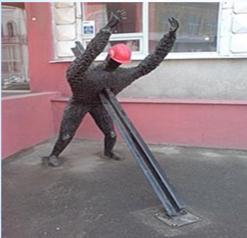
Пам'ятник робітникам метрополітену