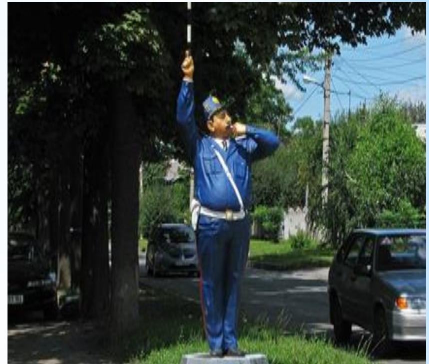
Пам'ятник співробітнику ДАІ