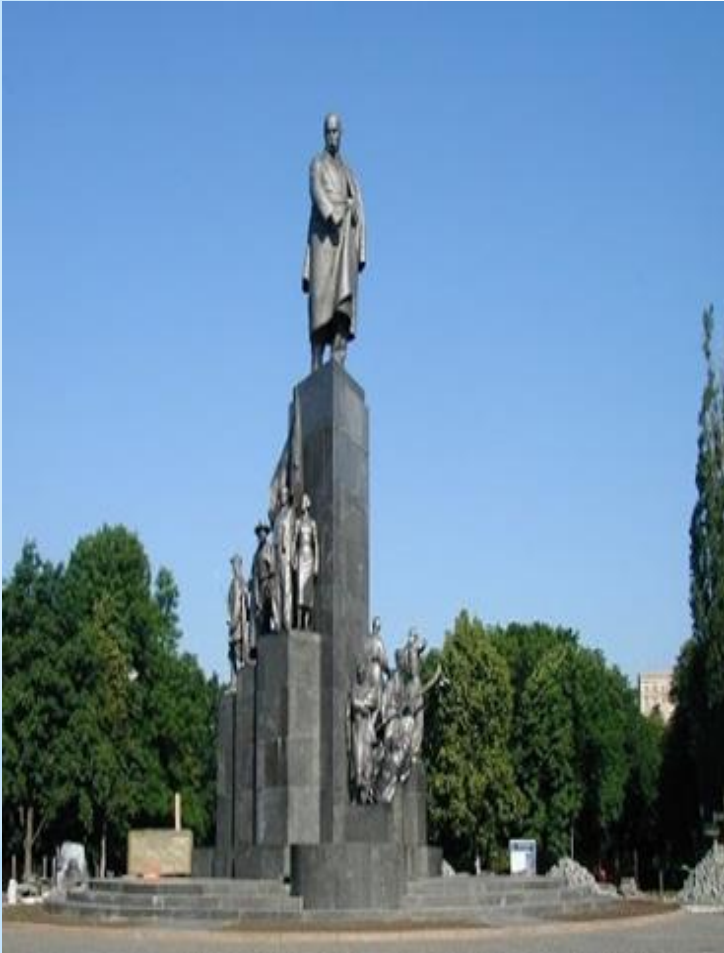
Пам'ятник Тарасу Шевченко