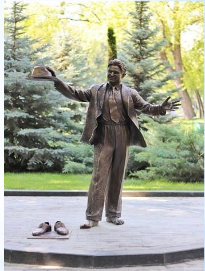
Пам'ятник Леся Курбаса