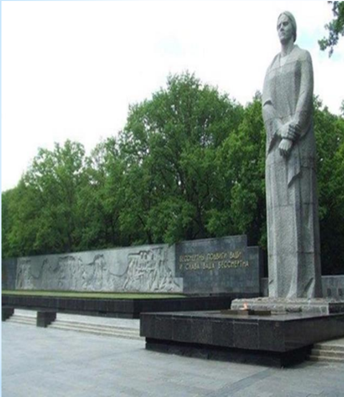
Меморіальний комплекс Слави